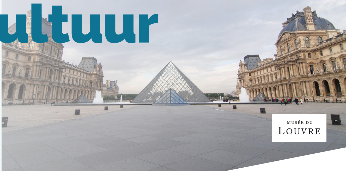
MUSÉE DU LOUVRE